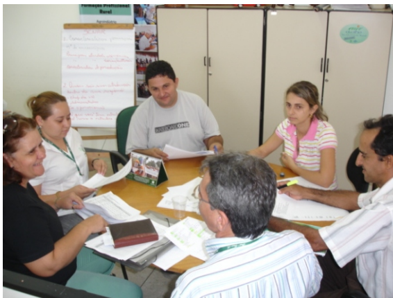
Equipe do Departamento de Educação Profissional durante a reunião de trabalho na sede do Sistema FAET/SENAR.